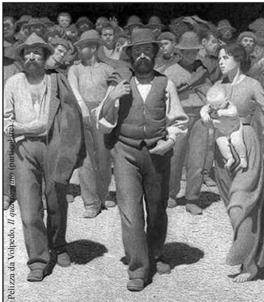
Pelizza da Volpedo, Il quarto stato (particolare)

Gruppetti d'operai condannati a risicà la propria occupazzione, ne l'incertezza d'una situazione che provoca scontenti e licenziati,