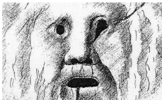
Canta Tito Tazio

– Sor presidè, je disse a la Boldrini, dovemo da parlà de cose grosse. Co l'acqua so' sartati li tombini e Genova nu' regge a certe scosse. E davanti a tale evento ciarimane lo spavento. Nun ce se crede... Bigna spicciasse e subito provvede.